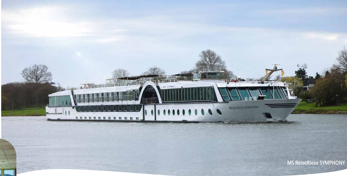
MS ReiseRiese SYMPHONY