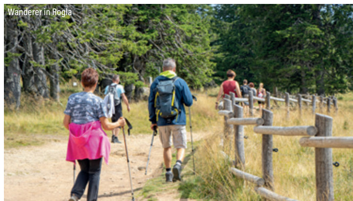
Wanderer in Rogla

Nach einem unvergesslichen und aktiven Aufenthalt treten Sie, analog zur Anreise, die Heimreise an. Die Rückankunft erfolgt am späten Abend.