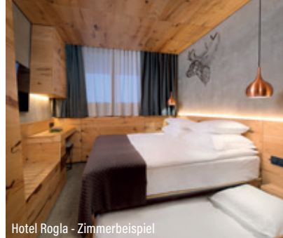
Hotel Rogla - Zimmerbeispiel