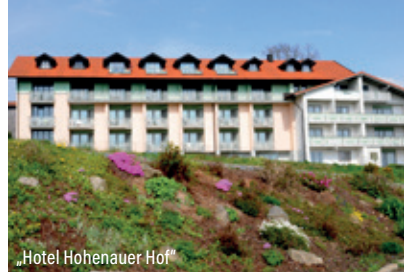
„Hotel Hohenauer Hof“